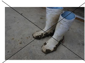
※汚れが落ちるような服装は禁止