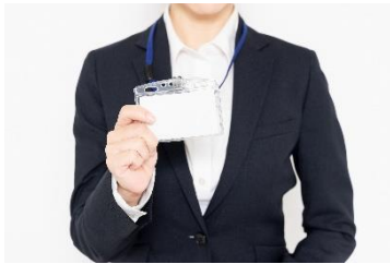
※ネームプレートは見えるところに着用

出荷の際は、それぞれ配布される ネームプレート を使用してください。 汚れがその場で落ちてしまうような服装や靴での出荷は禁止 させていただきます。